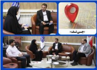
اجرای طرح ملی فیبر نوری منازل و کسب و کارها در شهر یزد سرعت می‌گیرد

در نشست با حضور معاون توسعه مدیریت و منابع استانداری، مدیرکل ارتباطات و فناوری اطلاعات استان، مدیر مخابرات منطقه یزد و مدیر ارتباطات زیرساخت استان، موانع و وضعیت موجود، جهت فعال سازی کامل مرکز داده یزد با هدف توسعه اقتصاد دیجیتال، بهره مندی دستگاه‌های دولتی و رفع نیازهای زیست بوم ICT استان مورد بررسی قرار گرفت.