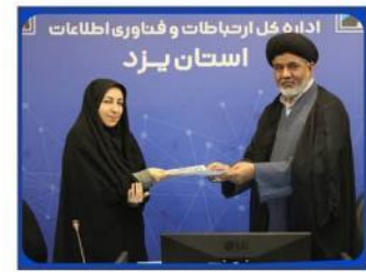
ضرورت افزایش اختیارات استان در شرکت‌های دانش بنیان و فناوری حوزه ICT و سبدهای حمایتی از شرکت‌ها

مدیرکل ارتباطات و فناوری اطلاعات استان یزد در نشست شورای اقامه نماز اداره کل ارتباطات و فناوری اطلاعات استان یزد که با حضور مدیر ستاد اقامه نماز استان برگزار شد، با اشاره به مسائل فرهنگی موجود در فضای مجازی، تولید نرم‌افزارهای کاربردی مرتبط با موضوع ترویج فرهنگ نماز، از حمایت اداره کل ارتباطات و فناوری اطلاعات از این نوع محصولات خبر داد.